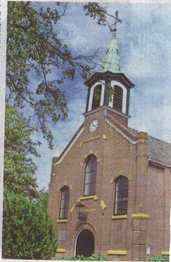
De protestantse kerk op Kaageiland.