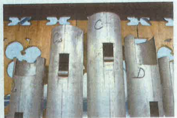
De metalen orgelpijpen: een ander deel is van hout