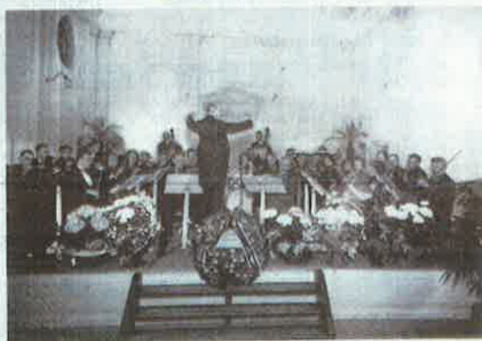
Een uitvoering van Crescendo in de Nutszaal, vermoedelijk rond 1914.

Ook Nut en Sport hield haar laatste vergadering. De vereniging van liefhebbers van allerlei soorten pluimvee kampte met een tekort aan leden. Het overgebleven kasgeld werd verdeeld onder andere verenigingen, zoals de postduivenhoudersvereniging de Luchtpost en kanarievriendenvereniging PLET. Zij kregen een wisselbeker als prijs voor hun wedstrijden. Jeugdbelangen, de Dierenbescherming en twee gymnastiekverenigingen kregen de rest van het geld. En zo werd er heel wat af vergaderd in de stad. De voorzitter van Onderlinge Hulp was heel tevreden. Er