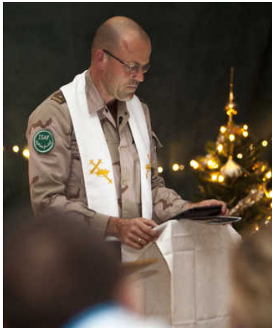
Kerst in Kunduz, kerkdienst voor Nederlandse militairen in Afghanistan.