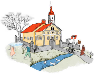
illustratie Gemma Pauwels