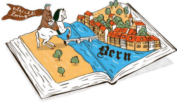
illustratie Gemma Pauwels