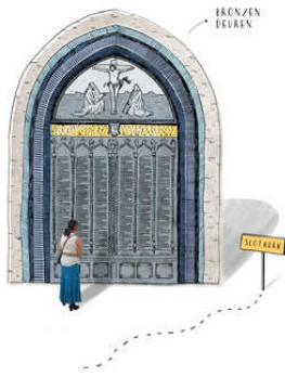
illustraties Gemma Pauwels