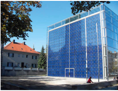
De Herz-Jesu-Kerk in München.