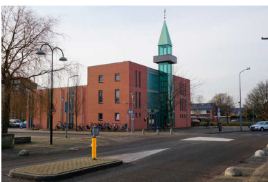
De Ar-Rahman-moskee uit Hoofddorp met een liftschachtminaret.