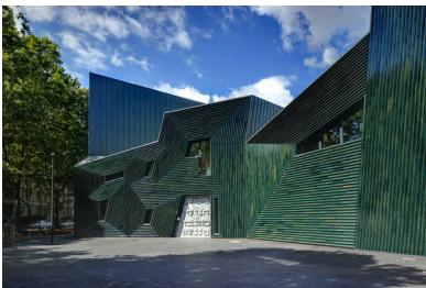
Het joodse gemeentecentrum 'Licht van de diaspora' in Mainz.