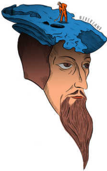
illustraties Gemma Pauwels