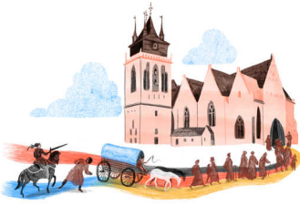
illustratie Gemma Pauwels