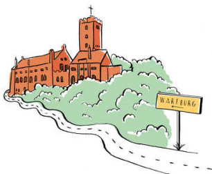
illustratie gemma pauwels