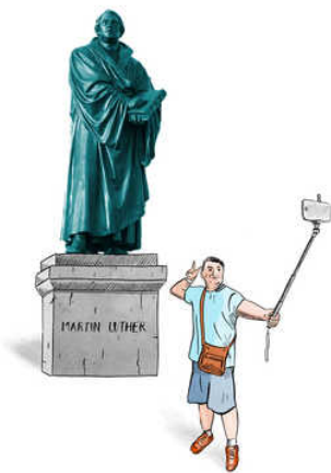
illustratie gemma pauwels