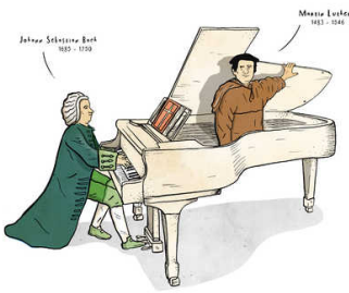
ILLUSTRATIE gemma pauwels